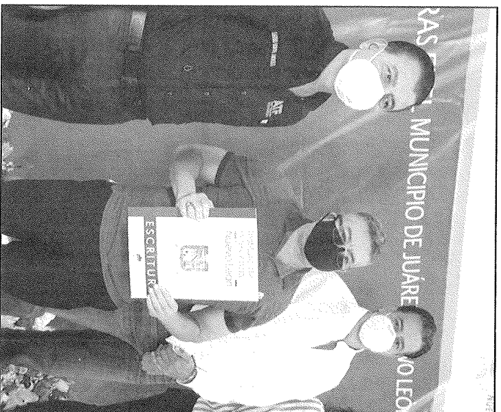
En las próximas semanas el municipio y Fomerrey formarán mesas de trabajo para ver el