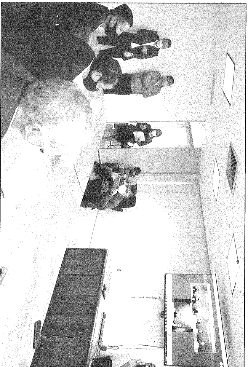
Ceremonia donde se firmó el convenio entre el municipio de Juárez, Infonavit y la SEDATU.

Las escrituras de Fomerrey, por una disposición del código civil, incluyen dos cláusulas: la de patrimonio familiar que tiene como finalidad proteger a la familia de algún embargo o venta, y la testamentaria, que solamente se da la disposición en caso de fallecimiento y queda en las partes proporcionales.